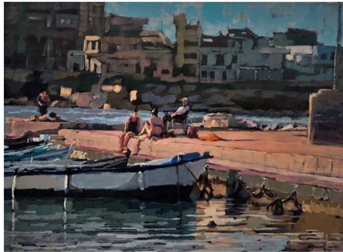
Sunset peace, 60 x 80 cm.

'Schilder niet wat je denkt te zien.' Dit citaat van een van haar docenten beschouwt Mitzy Renooy als haar voornaamste les. 'Een vaas is geen vaas. Hij bestaat