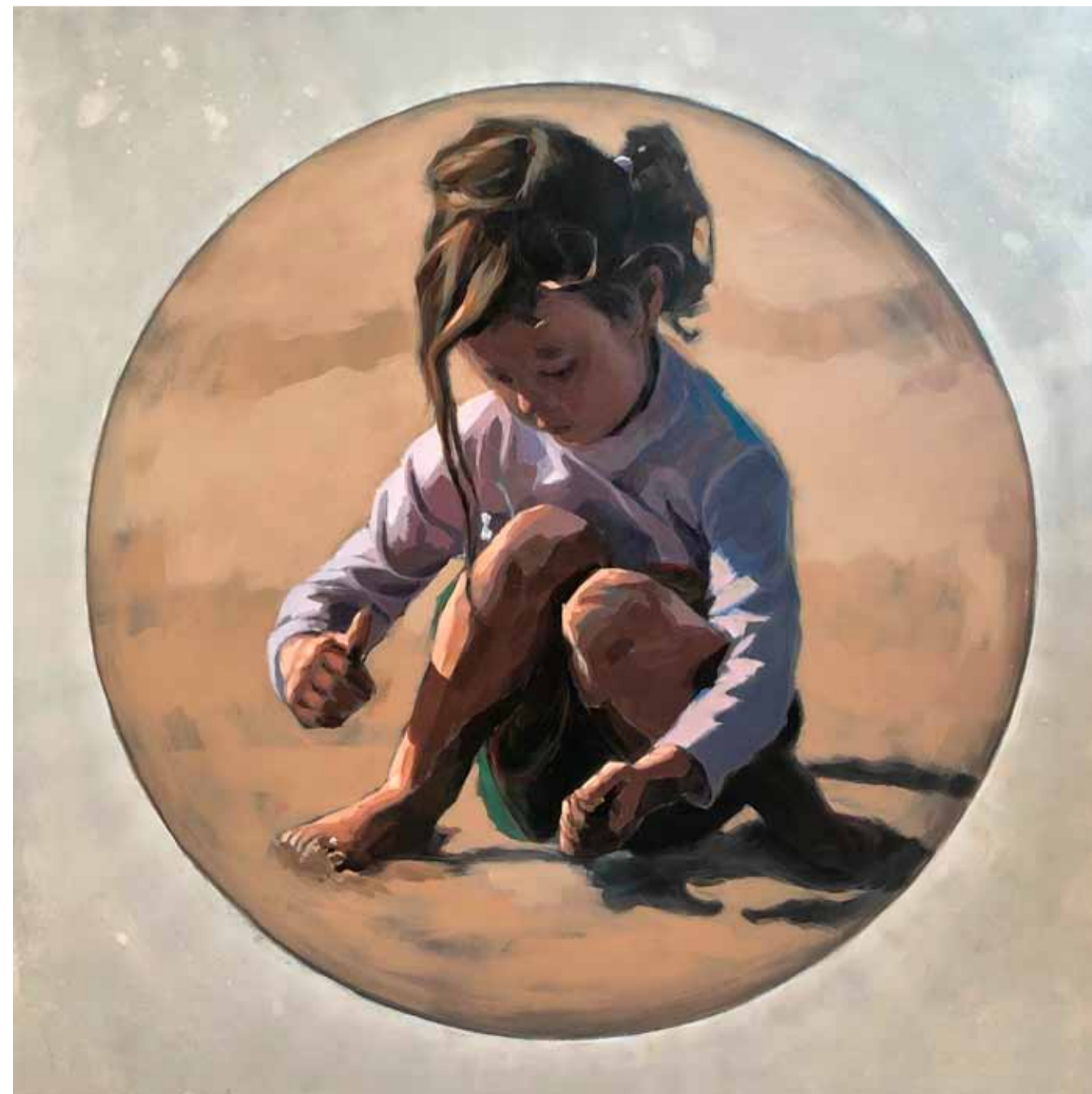
Fascination, 80 x 80 cm.