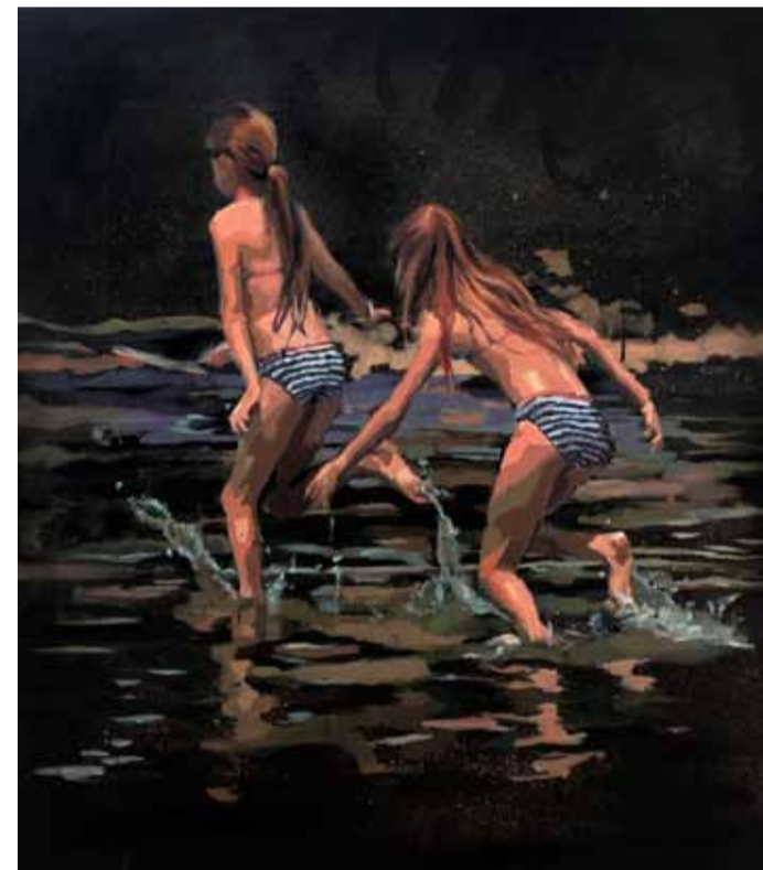
Twingirls, 80 x 70 cm.